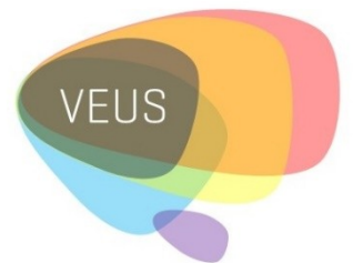
Visor de espacios urbanos sensibles